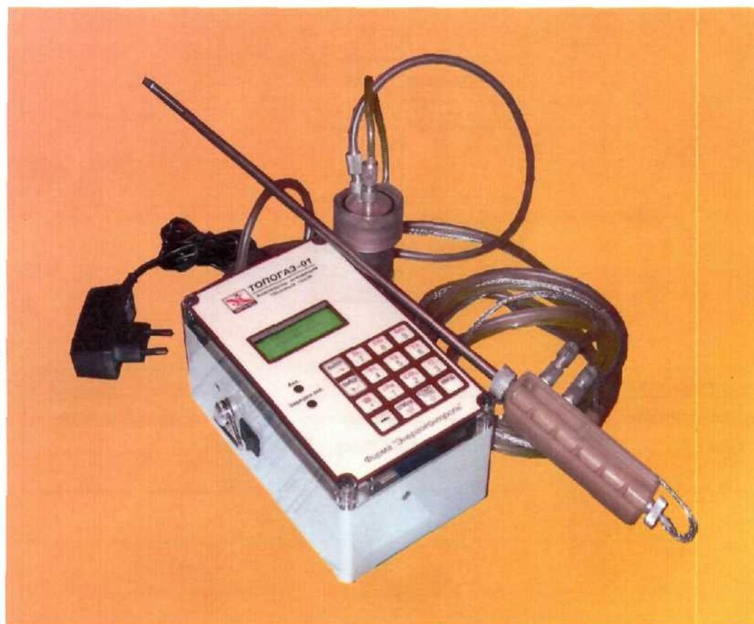
Рис.2 Общий вид газоанализатора «Топогаз-01»

ФК – фильтр грубой очистки с конденсатосборником; CO, NO, O 2 – электрохимические датчики для измерения концентрации кислорода, оксидов углерода и азота; dP – датчик давления; T 1 , T 2 – датчики температуры.